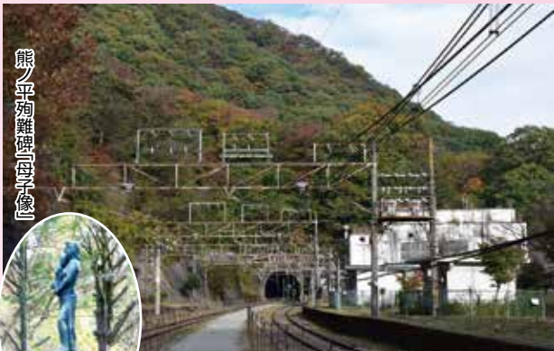
熊ノ平殉難碑「母子像」

熊ノ平は信越本線が通わなくなり、今はアプトの道の折返しポイントとして生まれ変わりました。当初単線であった期間、横川～軽井沢間で唯一の平坦地であった熊ノ平駅では、上下線の列車が待ち合わせすれ違いをしていました。この頃の熊ノ平駅は、行楽の季節、乗降客で賑わっていました。そして信越本線が複線化すると、熊ノ平駅は、変電所の機能を残して、駅としての機能は必要とされなくなりました。