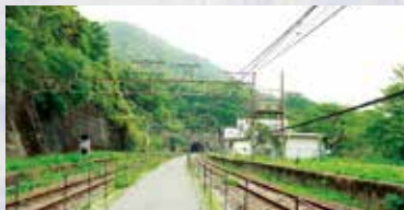
熊ノ平から10号トンネル方面