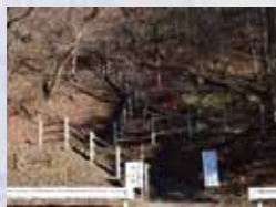
駐車場より熊ノ平への入口