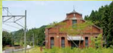
明治44年建造の旧丸山変電所は 国の重要文化財