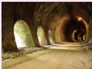
排煙口のある6号トンネル内部