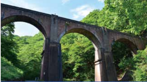
めがね橋 駐車場・トイレ有

芸術性で多くの人を魅了する、200万8000個のレンガで造られている日本最大の4連アーチ式鉄道橋。長さは91m、高さ31m。明治25年に完成した碓氷線のシンボル。駐車場、トイレは、橋を下り遊歩道を300m行くとあります。