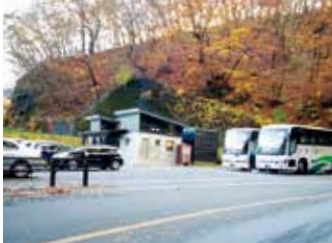
めがね橋無料駐車場

芸術性で多くの人を魅了する、200万8000個のレンガで造られている日本最大の4連アーチ式鉄道橋。長さは91m、高さ31m。明治25年に完成した碓氷線のシンボル。駐車場、トイレは、橋を下り遊歩道を300m行くとあります。