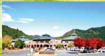
峠の湯は、アプトの道方面にも入館口有