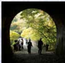
5号トンネルからめがね橋