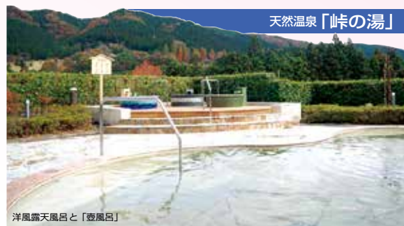
洋風露天風呂と「壺風呂」

お風呂は2階に和風・洋風大浴場(サウナ付)、露天風呂2カ所。風呂付休憩個室(要予約)も2室あります。アプトの道から直結した1階は入館無料。レストラン、売店、ロビー等をご利用いただけます。周辺観光の起点としても、ご活用ください。