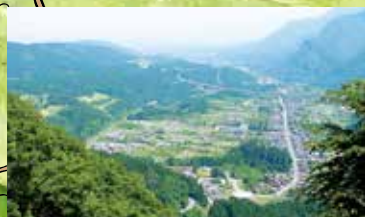
旧中山道途中、剋石山(剋)からの坂本宿