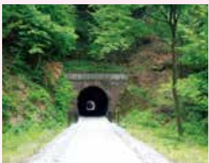
手前9号、その奥に8号トンネル

熊ノ平は信越本線が通わなくなり、今はアプトの道の折返しポイントとして生まれ変わりました。当初単線であった期間、横川～軽井沢間で唯一の平坦地であった熊ノ平駅では、上下線の列車が待ち合わせすれ違いをしていました。この頃の熊ノ平駅は、行楽の季節、乗降客で賑わっていました。そして信越本線が複線化すると、熊ノ平駅は、変電所の機能を残して、駅としての機能は必要とされなくなりました。