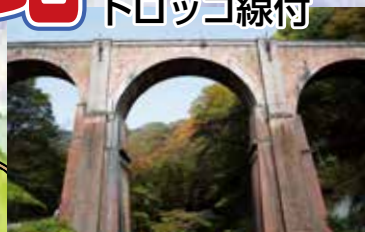
めがね橋(国の重要文化財) 左手に6号・碓氷第3橋梁・右手に5号トンネル