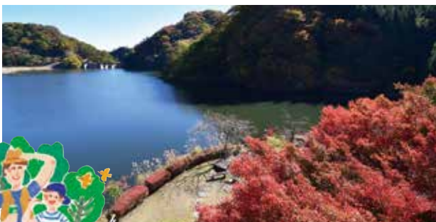
碓氷湖 駐車場・トイレ有 山景色に映える静かな湖。

見どころいっぱいの碓氷峠を巡る、遊歩道アプトの道をゆっくりと散策してみませんか。